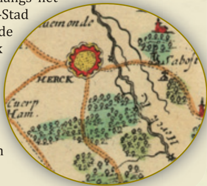
De Herk en Herk-de-Stad op de Carte des Pays-Bas (Fricx, 1712)

De woorden Harke, Herck en Herk verwijzen naar de gelijknamige rivier die langs het centrum van Herk-de-Stad stroomt. De naam van de rivier gaat waarschijnlijk terug op ar(i)ca , het Keltische woord voor kleine rivier. Bij deze weet u meteen hoe de Chiro-afdeling van Herk-de-Stad, Arika, aan haar naam kwam.