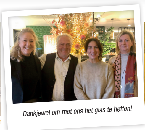
Dankjewel om met ons het glas te heffen!