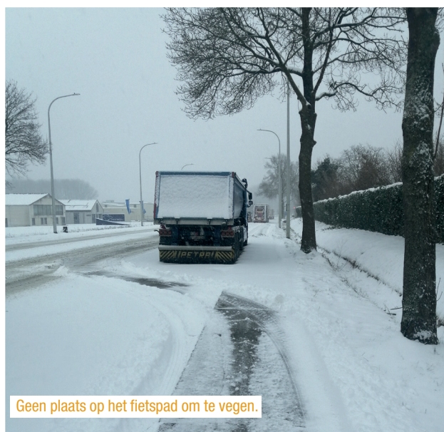
Geen plaats op het fietspad om te vegen.

Al jaren roepen we het gemeentebestuur op om werk te maken van een staanplaats voor vrachtwagens die nu langs de N2 parkeren. Dat is nodig: vrachtwagenchauffeurs moeten een veilige plek hebben om hun oplegger of aanhangwagen achter te laten en tegelijkertijd zal dit de levenskwaliteit van de bewoners naast de N2 verbeteren. Bewoners ervaren problemen zoals belemmerd zicht bij het uitrijden, nachtlawaai veroorzaakt door koelwagens die blijven draaien en gevaarlijke situaties voor doorgaand verkeer en fietsers. Tijdens winterse omstandigheden kan de veegwagen het fietspad zelfs niet vrijmaken. We stelden met onze N-VA-fractie vijf jaar geleden al voor om een oplossing te zoeken op het industrieterrein. Ons voorstel werd nog weggelachen toen, maar tijdens de begrotingsbesprekingen nu leek de meerderheid toch de bocht te maken richting ons voorstel. Doorgaan!