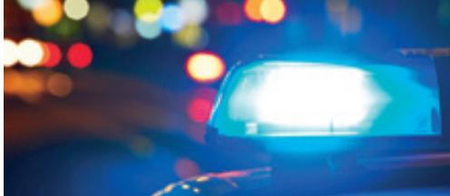
Michel Laenen over het nieuwe politiereglement p. 2