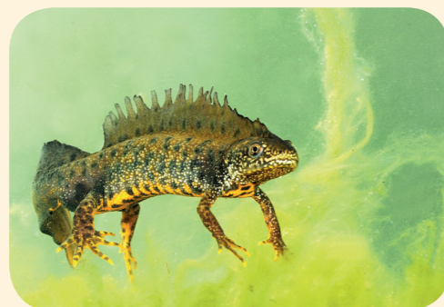
Wie kent de KAMSALAMANDER?

N-VA NIEUW wil binnen de meerderheid stappen zetten om de leefgebieden van bedreigde diersoorten te beschermen. Wist je bijvoorbeeld dat de Herkvallei een belangrijk leefgebied is voor de kamsalamander?