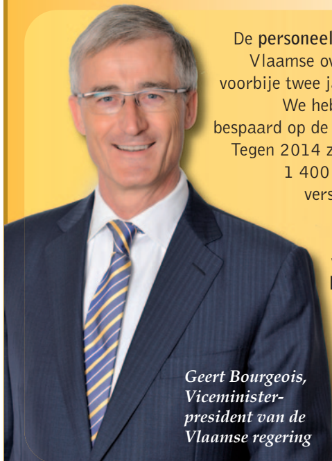
Geert Bourgeois, Viceminister- president van de Vlaamse regering

De personeelsbudgetten van de Vlaamse overheid daalden de voorbije twee jaar met 5 procent. We hebben ook drastisch bespaard op de werkingsmiddelen. Tegen 2014 zullen er bovendien 1 400 ambtenaren op de verschillende Vlaamse departementen niet stelselmatig vervangen worden. Een besparing van 50 miljoen euro per jaar!