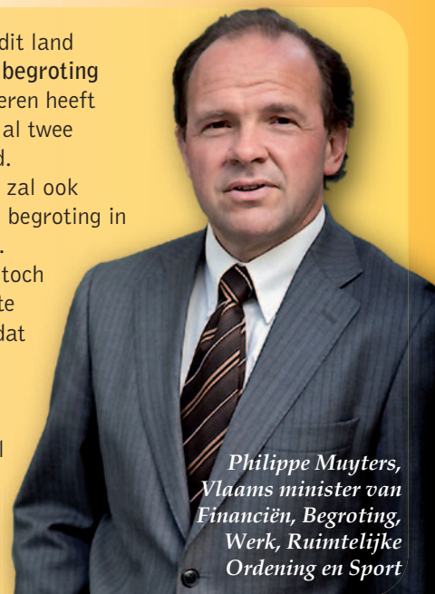
Philippe Muylers, Vlaams minister van Financiën, Begroting, Werk, Ruimtelijke Ordening en Sport

Als enige overheid in dit land heeft Vlaanderen een begroting in evenwicht. Vlaanderen heeft de voorbije twee jaar al twee miljard euro bespaard. De Vlaamse Regering zal ook de volgende jaren een begroting in evenwicht voorleggen. Als er geleidelijk aan toch wat budgettaire ruimte komt, investeren we dat zoals Europa vraagt: in onze economie (O&O, infrastructuur, werk ...) en in sociaal beleid (kinderopvang, wachtlijsten gehandicapten, kindpremie ...).