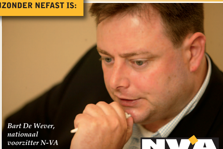
Bart De Wever, nationaal voorzitter N-VA