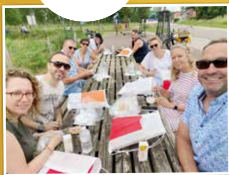
▲ We namen deel aan de Herkse Smikkeltocht. We hebben enorm genoten van het lekkers en de prachtige fietstocht!