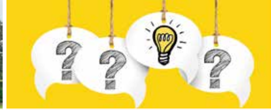
Wat doen we voor jou? (p.3)