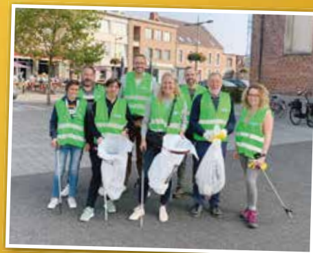
▲ We werkten mee aan de zwerfvuilactie straat.net en hielpen zo 26 Herkse straten en bermen proper te houden.