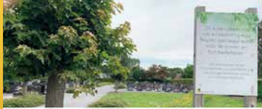
Vandalisme op Herkse kerkhoven (p.2)