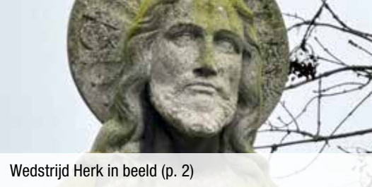
Wedstrijd Herk in beeld (p. 2)