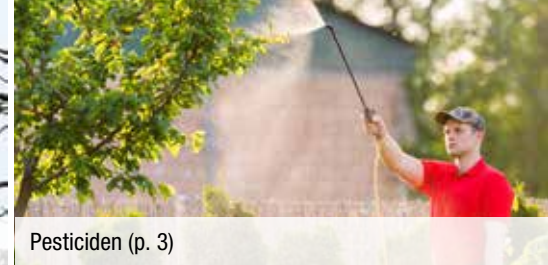
Pesticiden (p. 3)