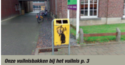
Onze vuilnisbakken bij het vuilnis p. 3