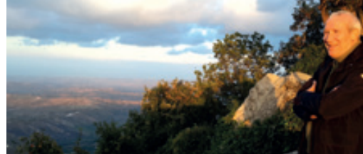
Danny Jammers' blik op de wereld p. 5