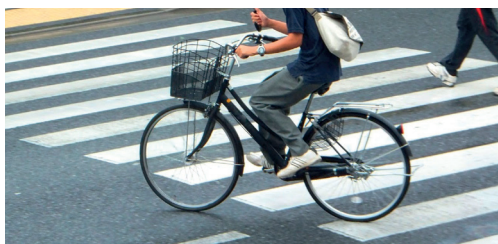
Veiliger fietsen in Herk p. 2