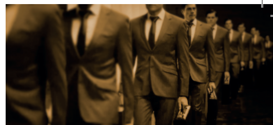
Enkel mannen in pak? p. 3