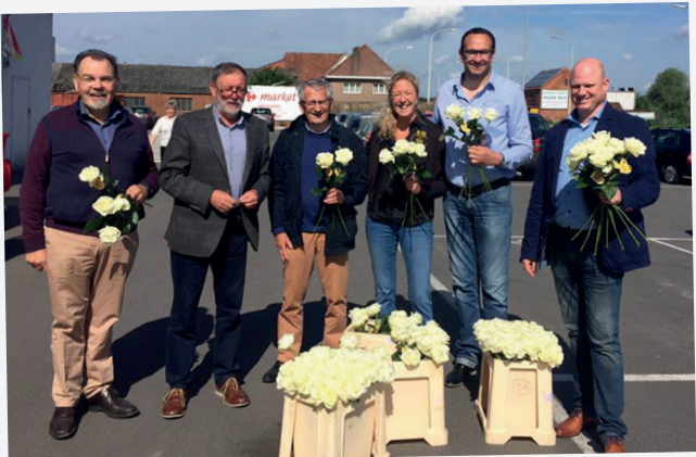
'N-VA Herk-de-Stad wenste de Herkse mama's een fijne Moederdag met een roosje onder een stralende lentezon.'